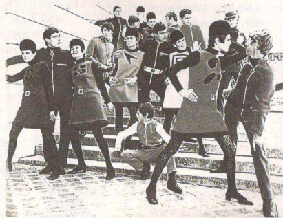
图 1-2-5 皮尔·卡丹的未来主义

规模化、大批量化生产,成衣价格也相对低廉,被消费大众所广泛接受。20世纪最后十年的服装设计色彩明亮素净,没有夸张的因素,廓型合身而不紧身,装饰简单且不抢眼,只保留必需的功能性,设计已经简单到不能再简单。常见的大众成衣品牌有:爱斯普瑞特(Espri)、李维斯(Levi's)等。