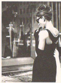
图1-2-3纪梵希为电影演员英格丽·赫本设计的礼服