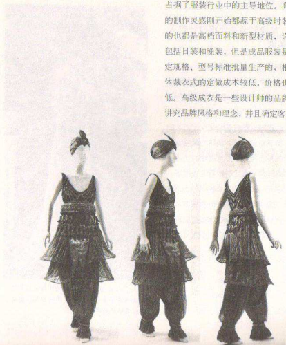
图1-2-2保罗·波烈设计的“一件一晚”礼服,完全打破中规中矩的造型结构

现代服装设计的奠定是在1930—1940年这10年间,主要体现典雅、美观和大方的特点,强调场合和服装的对应性。对应于1933年以前的经济危机时期,服装的外观设计平直,强调向下的流动感和平坠感以追求苗条修长的身段。1933年裙摆最长拖到地面。1938年二次世界大战爆发,一时间服装开始了怀旧式的新维多利亚风格。但是同时,战时服装对功能性的追求也在加强,女装开始步入男装化的时代,军服和工装格调也出现在时装设计中,裤装、垫肩、战壕式风衣、跳伞服和背带裤风行一时。1947年的战后,迪奥(Dior)推出了被新闻界称为“新风貌”的设计。