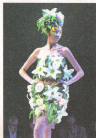
图 1-1-1 以植物作为元素成为服装整体的组成部分之一

服装设计顾名思义是设计服装款式的一种行业。服装设计的过程包括:根据设计对象的要求进行构思,绘制出效果图、平面图,再根据图纸进行立体制作,达到完成设计的整个过程。服装设计的对象是服