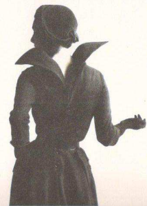
图1-2-4克里斯汀·迪奥在1948年设计的代表作“后开式伊丽沙白领”羊毛外套