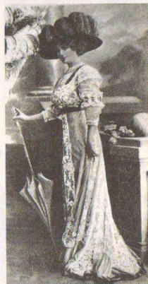
图1-2-1 保罗·波列设计的希腊风格礼服,完全抛弃了束縛女性腰身的钢丝架,贯通了阔筒宽松的流畅线条

高级时装所用的材料十分昂贵,做工极为精细,价格也同样不菲,其消费者大都是王宫贵族、各界名流,是真正的“小众时尚”。(图1-2-1、图1-2-2)